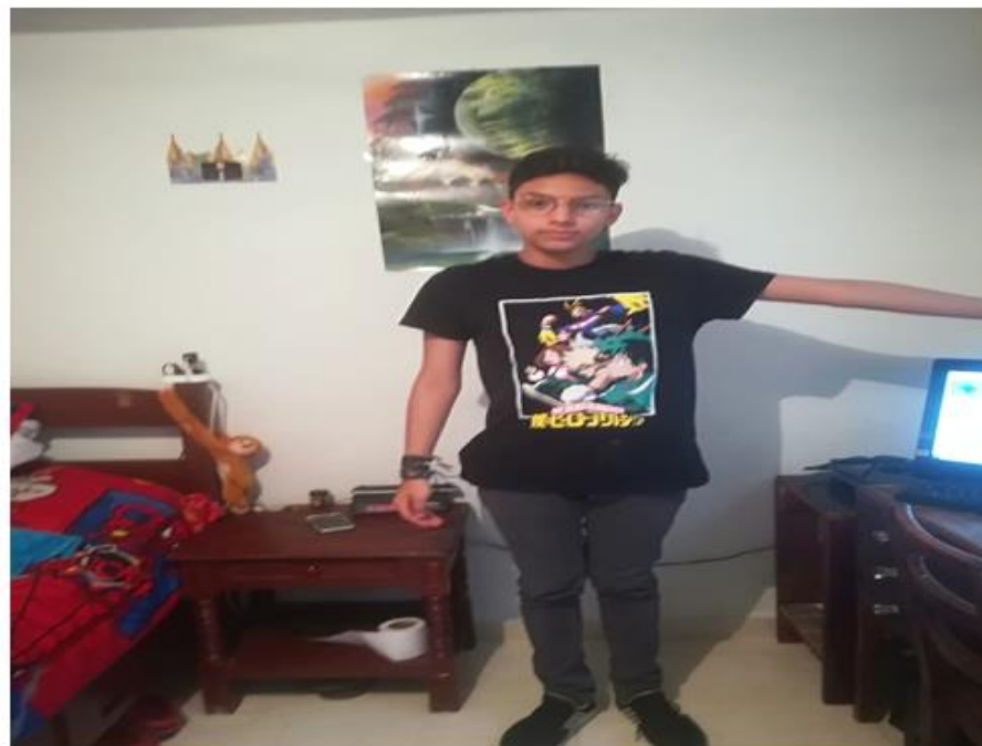
si me paro de mano derecha al sol estaria en el , oeste