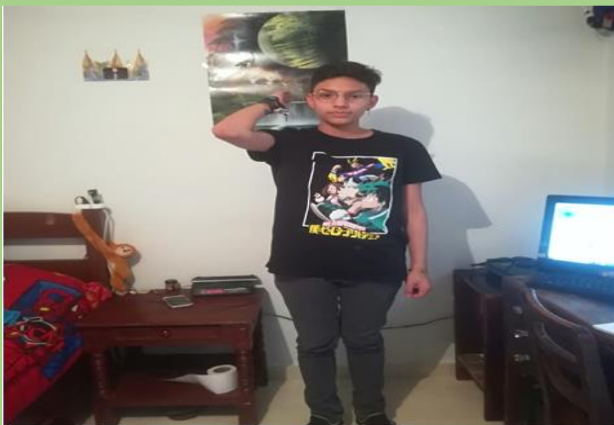
si me paro de mano izquierda al sol estaria en el , este

Ahora vamos a reconocer los puntos cardinales mediante el cuerpo humano, el sol siempre sale por el oriente (este), en Bogotá el oriente es por donde quedan las montañas, en específico donde está Monserrate; así que si te paras de espaldas a donde sale el sol, el norte quedará por donde está tu mano derecha, el sur en tu mano izquierda el occidente (oeste al frente tuyo y el oriente a tu espalda), ahora veremos un ejemplo: