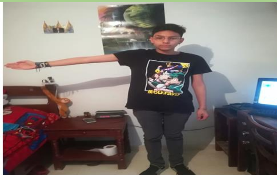
sur direccion donde sale el sol