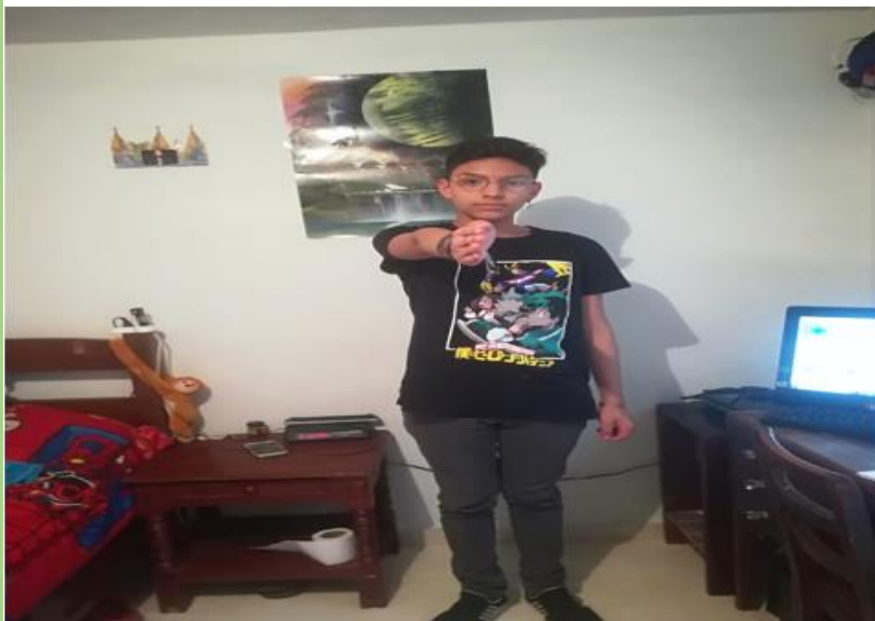
si me paro dandole la espalda al sur , estaria de frente al norte